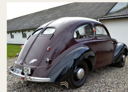
Det påstås, at Hanomag'ens bagende var en stærk inspirationskilde for for folkene bag Volvo 444.

Tekst og Billeder: Gerner Nielsen. (Mr. Wolseley)