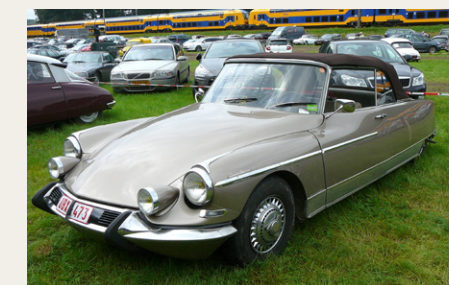
Citroën DS Palm Beach, Henri Chapron special-model

Her er nu også ankommet en ekspedition fra Danmark, „La Croissière Orange”.