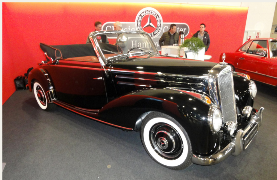
1955 Mercedes-Benz 220 Cabriolet A - meget høj kvalitet og meget høj pris.

Så var der stjerne-afdelingen. Ufattelig mange af dem, de fleste restaureret til ekstrem høj klasse og tilsvarende priser. Bl.a. en Mercedes-Benz 220A fra 1955, 6 cyl./80 hk og superflot, men 1,6 millioner danske kroner er vel også en sum penge, og ikke engang fast tag! Herefter styrehuset i en Mercedes-Benz 220 S Coupe, årg. 1957, og 900 t.kr. billigere end før omtalte, men stadig manne peng. Sendte en SMS retur til fru Kristensen med anmodning om at sende mig lidt penge, negativt svar!