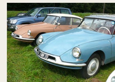
Et par tidlige Citroën ID modeller.