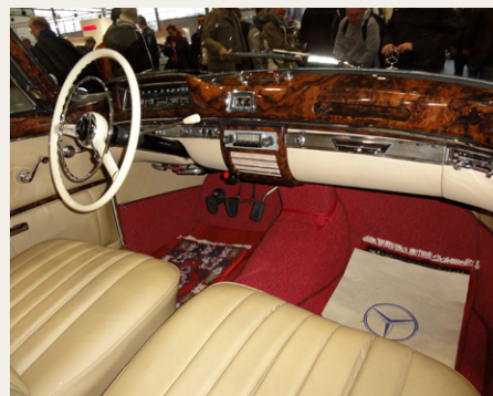
En 1957 Mercedes-Benz 220 S Coupe er meget billigere, men stadig meget dyr.

Så var der stjerne-afdelingen. Ufattelig mange af dem, de fleste restaureret til ekstrem høj klasse og tilsvarende priser. Bl.a. en Mercedes-Benz 220A fra 1955, 6 cyl./80 hk og superflot, men 1,6 millioner danske kroner er vel også en sum penge, og ikke engang fast tag! Herefter styrehuset i en Mercedes-Benz 220 S Coupe, årg. 1957, og 900 t.kr. billigere end før omtalte, men stadig manne peng. Sendte en SMS retur til fru Kristensen med anmodning om at sende mig lidt penge, negativt svar!