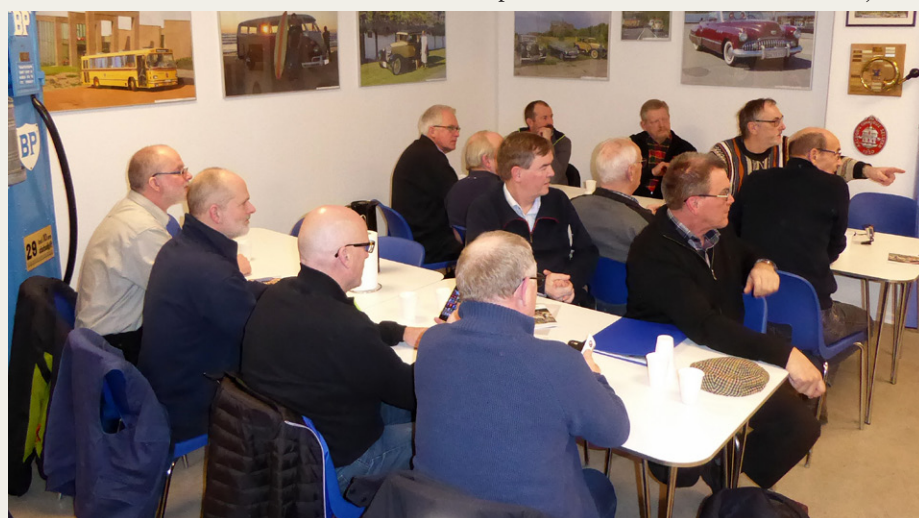
Deltagerne lyttede interesseret og deltog flittigt i aftenens diskussioner.