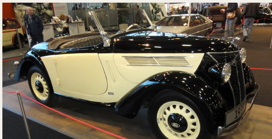
1939 Ford Eifel bringer minder om forældrenes første bil.

Ford Eifel årg. 1938 bringer mine tanker tilbage på mine forældres første bil, købt godt brugt og slidt i 1962. Den her viste årg. 1939 er af en helt anden klasse og ganske sød.