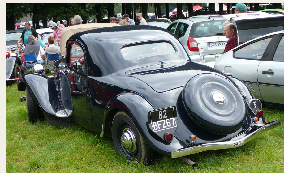
En meget sjælden Citroën 11 BI Coupe.

Nu regner det virkelig meget, og om natten var der målt den laveste august