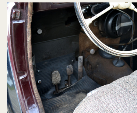
Pedalarrangementet i Hanomag'en. Ved siden af speeder sidder aktivering til selustarteren, og oppe til venstre sidder trykanordningen til smøring af styretøj.