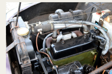
Motoren i Hanomag'en er en 1,3 liter sideventilet rækkemotormed en effekt på 32 hk.