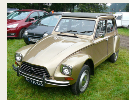
Meget flot Citroën Dyane.