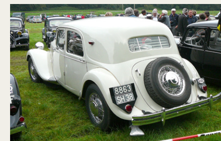
Citroën 15 Six med Robergel trådhjul.