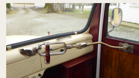
. . . og det gælder i mindst lige så høj grad den flotte messing dørmechanisme.