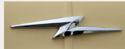
Bussens front er prydet af dette stilliserede lys, som jo bedder Blitz på tysk.