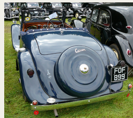
Engelsk bygget cabriolet med instrumentbord i træ og Lucas udrustning.

Hollænderne havde lavet et kæmpearbejde for at stable det 16. ICCCR på benene. Stor tak og ros til dem. Specielt var bade- og toiletforholdene på campingområdet over forventet. Hele træfområdet var dejligt kompakt, det var muligt at bevæge