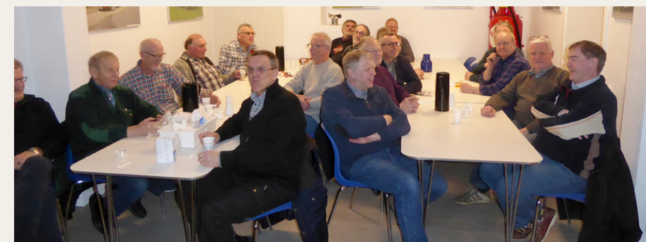
De ca. 30 medlemmer, som var mødt op til foredraget, følte sig godt underholdt.