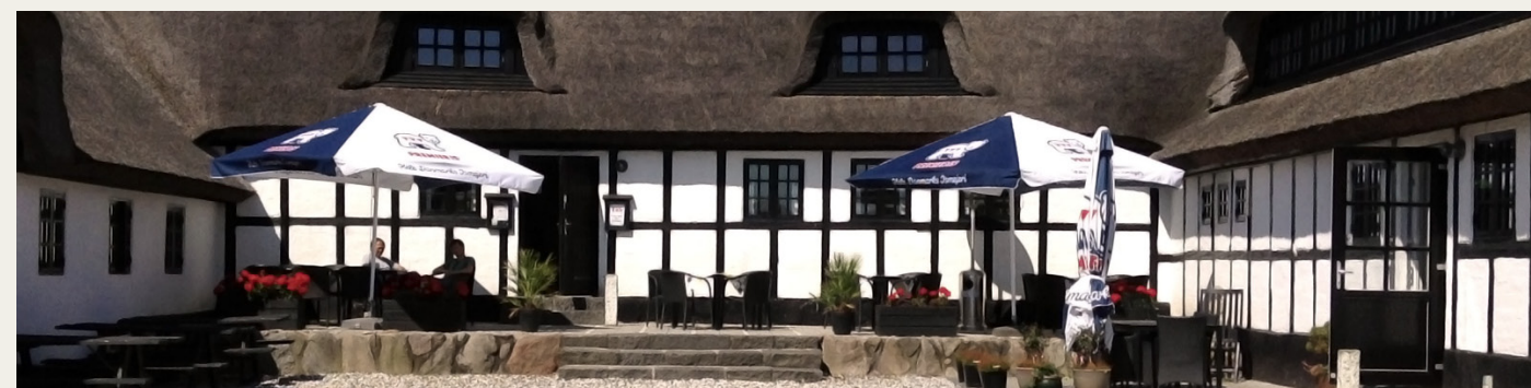
Den charmerende Kalø Strandgård er Kalø Campings hjerte og har en historie, der går langt tilbage.