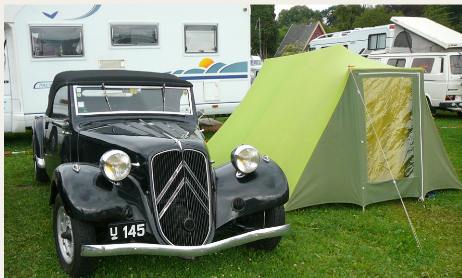
Vores 1937 Citroën 11B Cabriolet parkeret ved siden af vores lækre retortelt anno 1976.