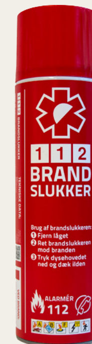
Denne fikse lille brandslukker, med navnet 112 Brandslukker er i dag godkendt af mindst ét veteranforsikringsselskab, men andre holder fast i, at der skal være en 2 kg brandslukker i veteranbilen.