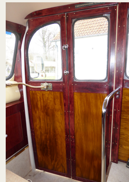
Den indvendige dorbeklædning ligner et helt kunstværk . . .