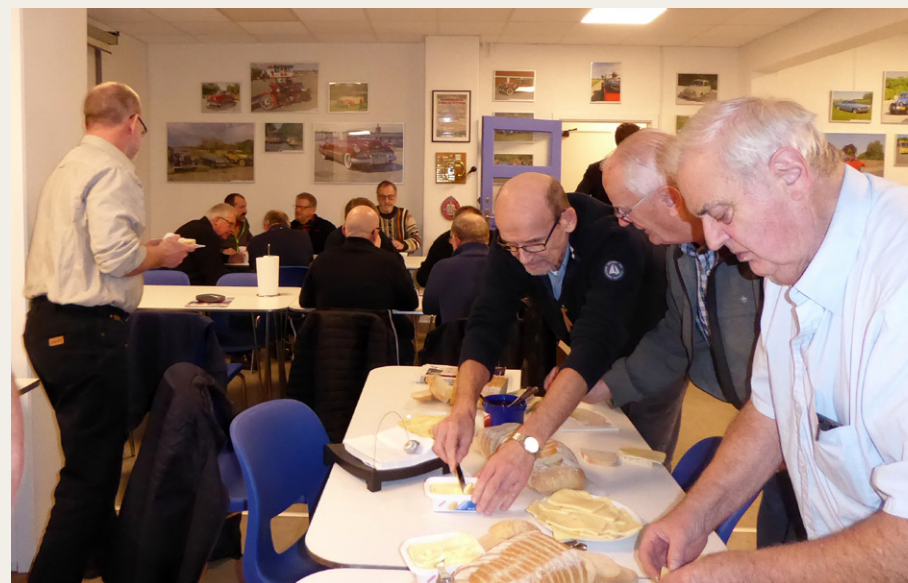
I pausen var Nordjysk Vintage Motor Klub vært ved en smør-selv ostemad og kaffe.