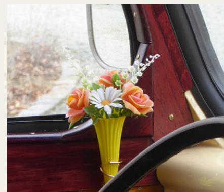
Finn har også fundet plads til denne hyggelige blomstervase, som var så populær i halvtresserne.