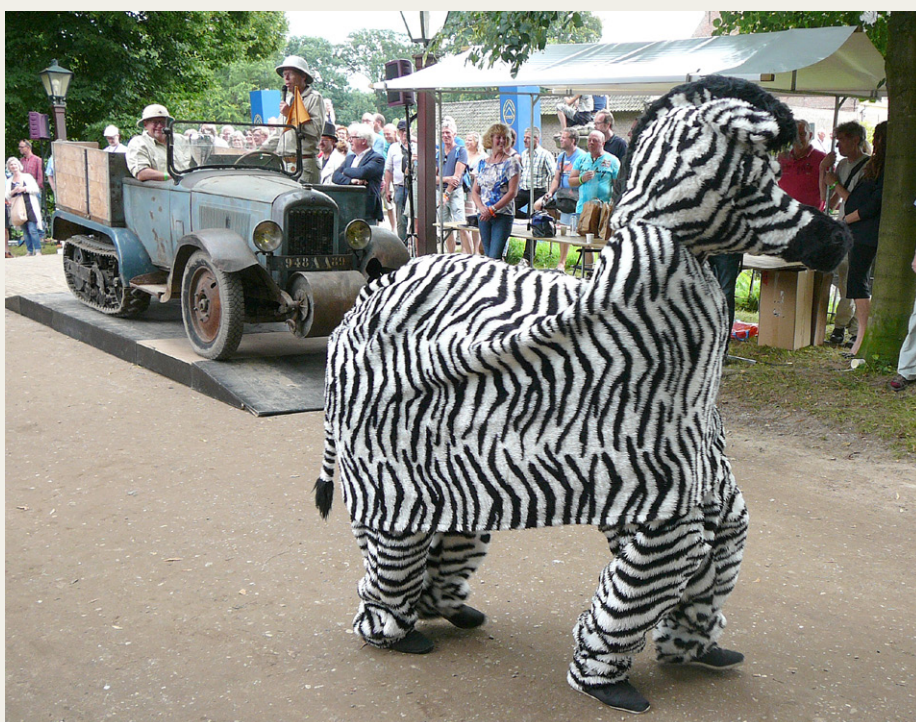
Dansk Citroën Kegresse på Zebra jagt.