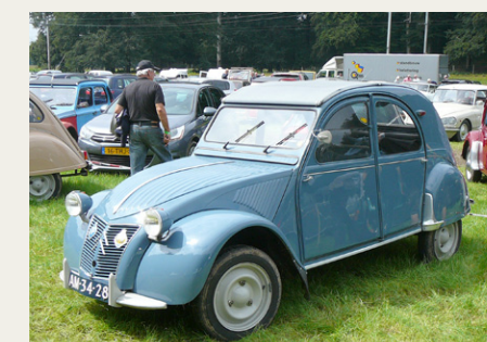
En meget pæn Citroën 2CV fra 50'erne.