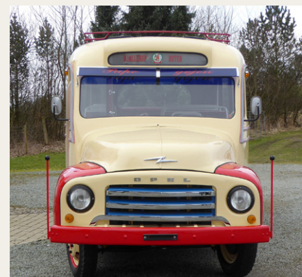
Så er den gamle Dame klar til at indtage vejene omkring Hjøllrup.