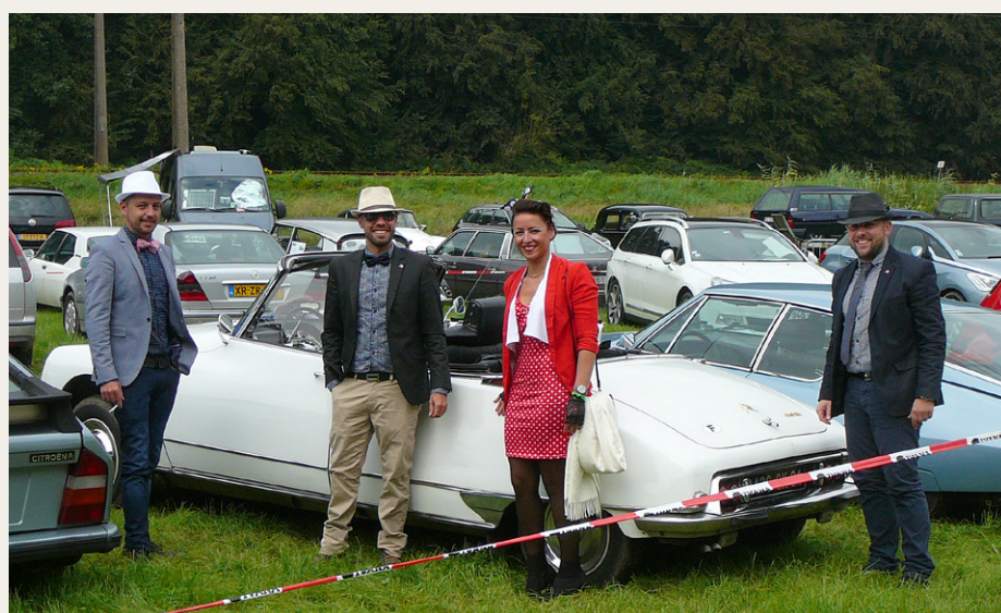
Citroën DS Cabriolet med besætning.

Dagen ender i byen Nordhorn, så er vi faktisk ikke langt fra Holland, efter lidt kørsel i byen finder vi igen et godt og billigt hotel, ovenikøbet med parkering under tag. Vi finder en Græsk restaurant og tænker, at de nok trænger til lidt opbakning i disse tider, hvor ikke alle tyskere elsker Grækenland. Det var god mad og vin til billige penge.