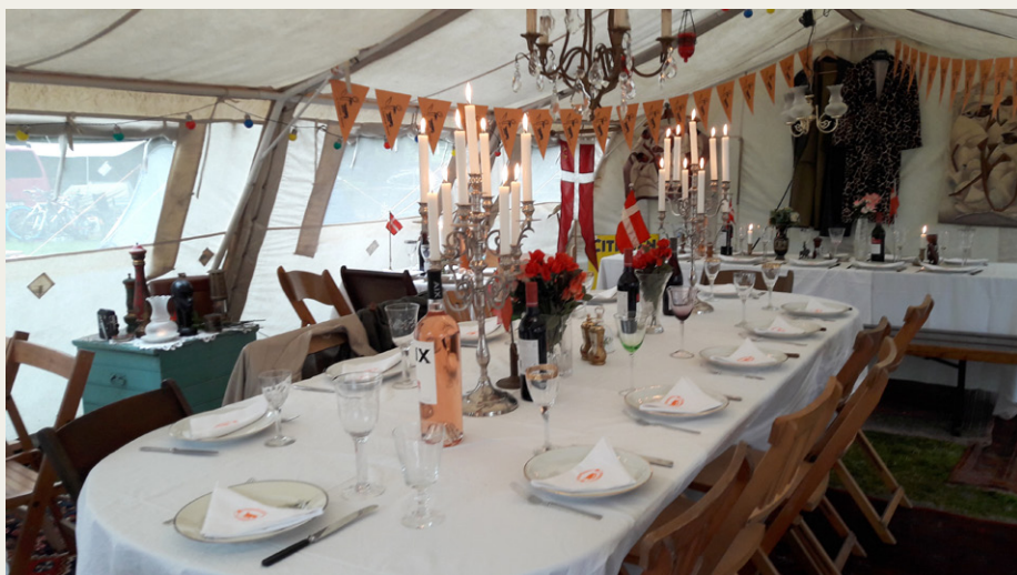
Dækket op til festmiddag i ørkenfeltet.