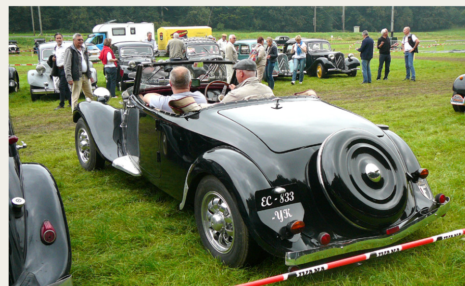
Højrestyret fransk bygget Citroën 11B cabriolet.