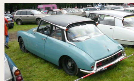
Citroën DS afskåret til Rallykørsel

Vejret er ikke overbevisende, men vi starter dagen med taget nede. Efter et par timer er vi sikkert over Elben og vender næsen mod Holland, det burde være „piece of cake”. Der viser sig dog lige en udfordring i Bremen, hvor det nu regner seriøst og vi bruger „lidt” tid på at lede efter en bro over Weser, som måske slet ikke er der? Det ender i hvert tilfælde med en færge i byens nordlige ende, men så er resten af turen også „bare ligeud ad landevejen”.