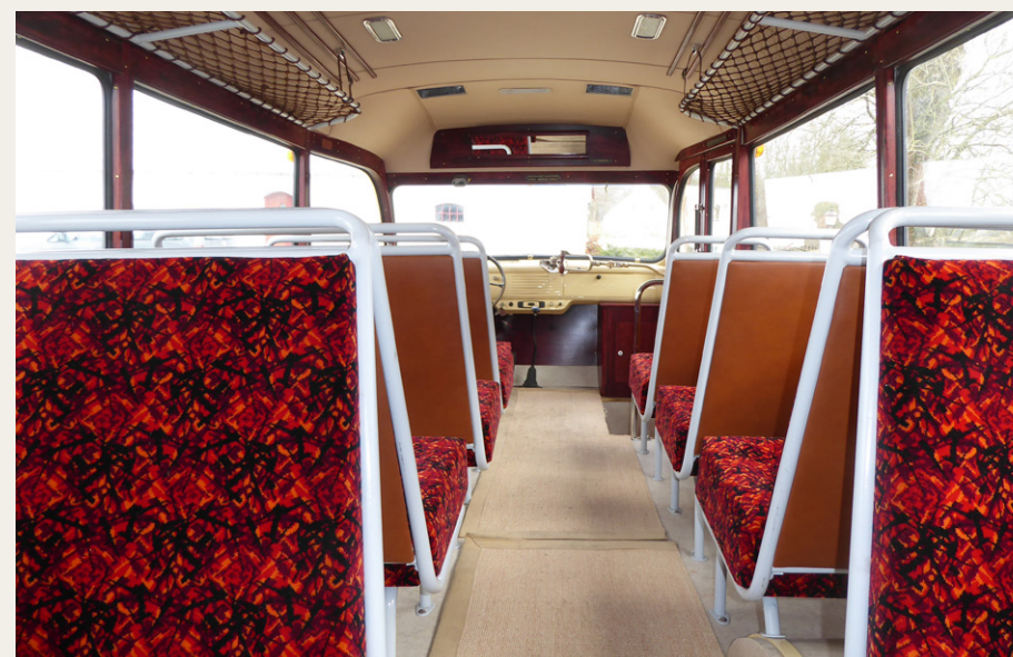
Fra bagsædet i den nyrenoverede bus er der ikke udsigt til voldsomt mange siddepladser, men de, der er, er utrolig flotte at se på.