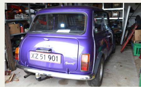
Der var også en lille Morris Mascot fra 1975, som bliver brugt flittigt.