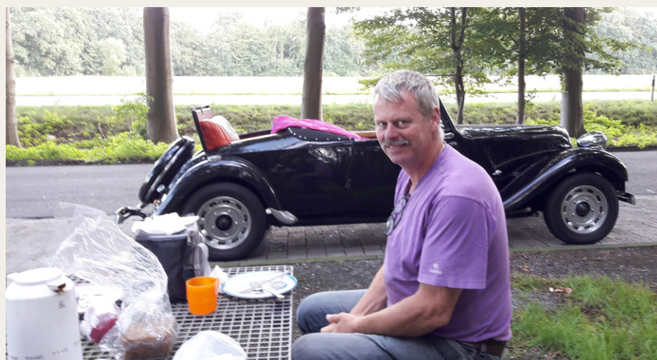
Frokostpause på vej til Holland.

Olien på Cabriolet'en er forholdsvis nyskiftet og lakken forholdsvis nypoleret. I dagene op til afgang bliver der også tid til en tur med fedtsprøjten samt check af diverse væsker. Så kan den forhåbentligt