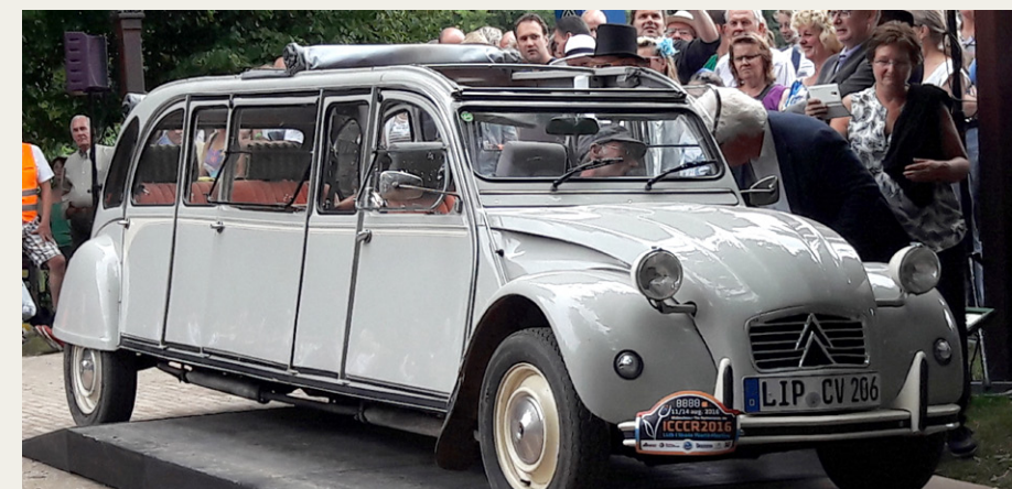
Citroën 2CV limousine, som ejeren havde bygget for at få plads til alle otte børn.