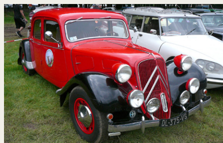
Citroën 11B med FEM-trins gearkasse - bemærk bulen i kolergritteret mellem de nederste bytter.

Træffet fortsætter. Der er virkelig mange Citroën'er på gæsteparkeringen. Et område er reserveret til Traction Universelle (Fransk klub), der var simpelthen alt i Traction, fra de fedeste originalbiler til toprestaurerede eksemplarer. En Traction havde en ikke før set detalje: FEM-trins gearkasse! Topscorer i deltagerantal var uden tvivl ID/DS-modeller, her var bare biler i alle regnbuens farver, skønt at skue. Den største overraskelse, var de mange „nye” C6'ere, det er helt klart en model der taler til entusiasten nu og måske i fremtiden?