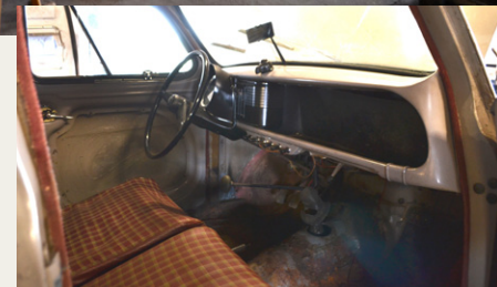
Interiøret i den gamle Standard er ret simpelt.