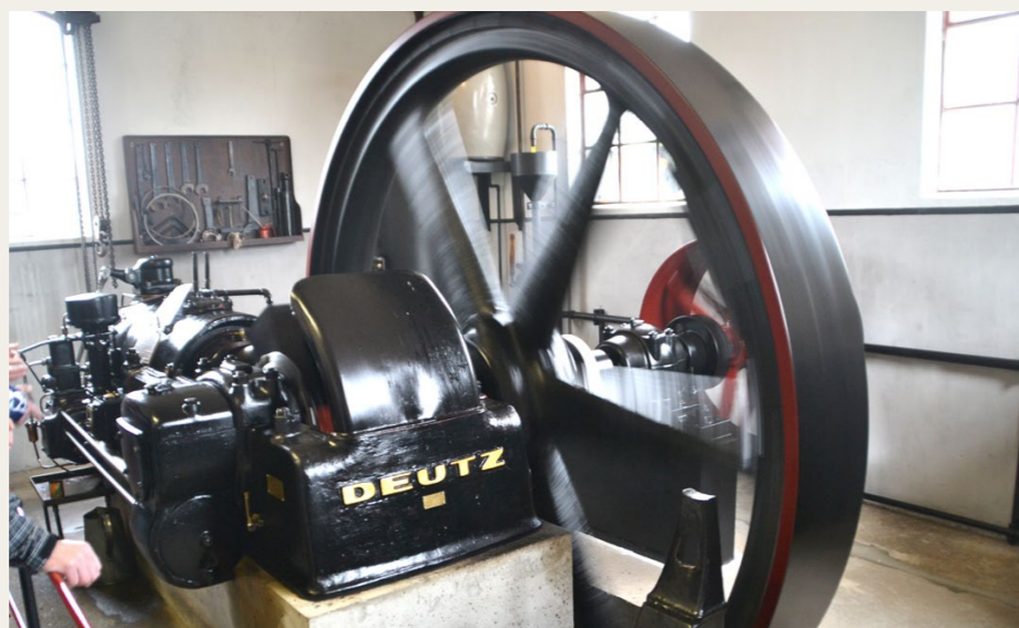
En af Dansk Motorsamlings perler er denne imponerende vandretliggende én-cylindret dieselmotor, som har et slagvolumen på hele 67.000 ccm. Motoren, som yder 80 hk, har fra ny i 1930 trukket et el-anlæg under Aalborg El-forsyning. Senere har den trukket et savværk i nærheden af Ebeltoft.