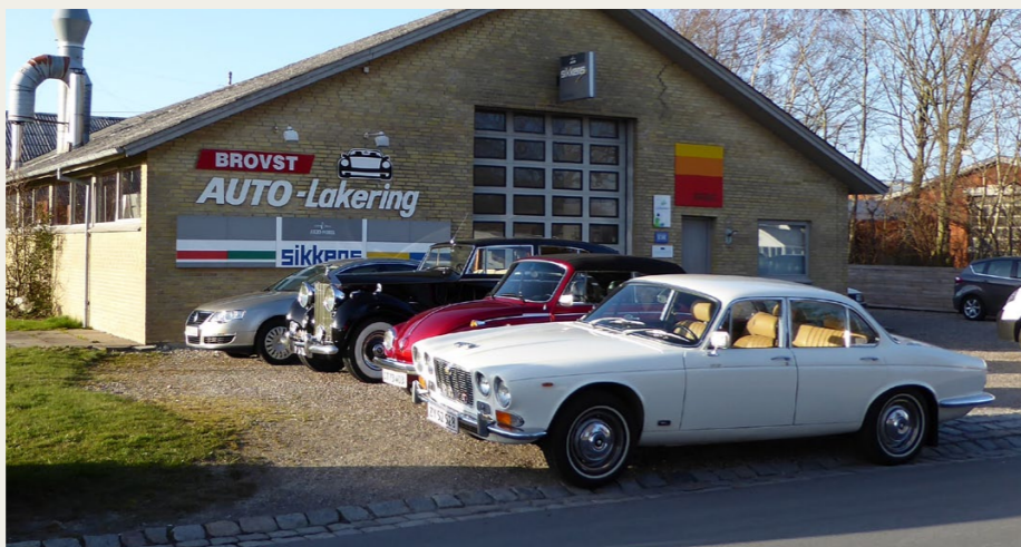
Flere af dagens gæster på Brovst Autolakering var mødt op i deres veteranbiler.