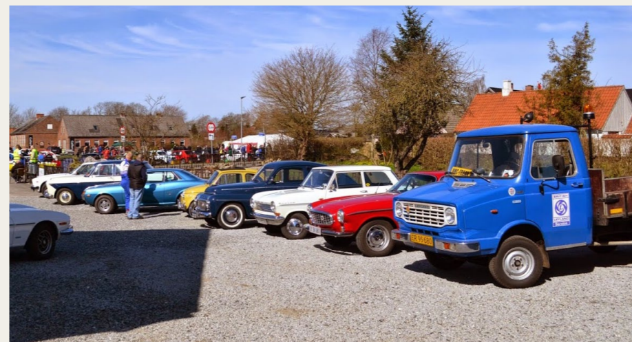
Et lille udsnit af de mange veterankøretøjer, som havde fundet vej til Gl. Skørping i forbindelse med Historisk Motor Sport og Gl. Skørping Borgerforenings Hill Climb arrangement.