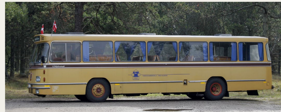
Tag med bussen til Hjørring den 8. august

Husk at klubbens bus deltager i dette arrangement, og at du kan deltage sammen med bussen. Læs mere på side 5.