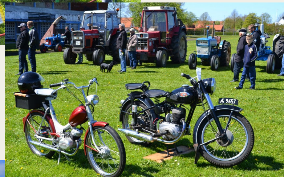
På det gamle stadion var der både store traktorer og små traktorer, og der var både knallerter og motorcykler.

Et rigtig spændende arrangement hvor der er meget forskelligt at se på, bla. præsentation af de mange traktorer, og hvor der er gang i de mange stationære moto-