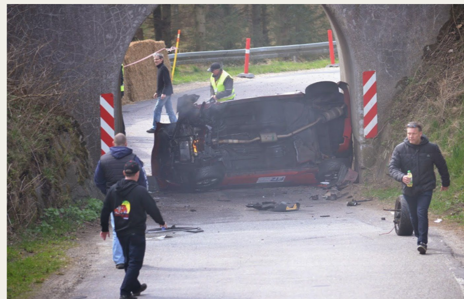
Det var ikke alle, der slap godt fra at udfordre den smalle viadukt under jernbanen. Heldigvis skete der kun materiel skade.