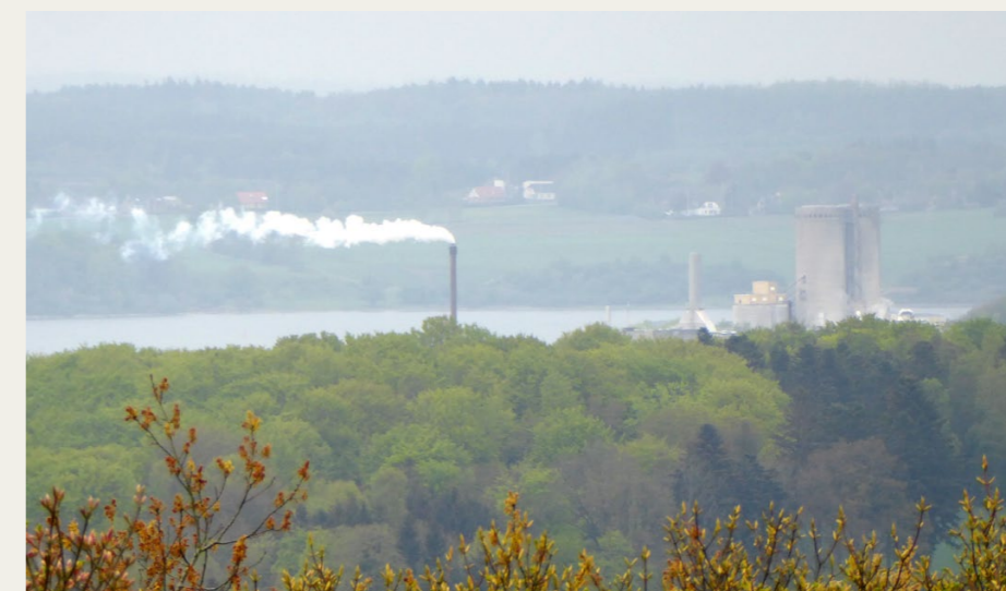
Fra toppen af den smukke Hohøj er der blandt andet udsigt til skorstenene og siloer i Dania.