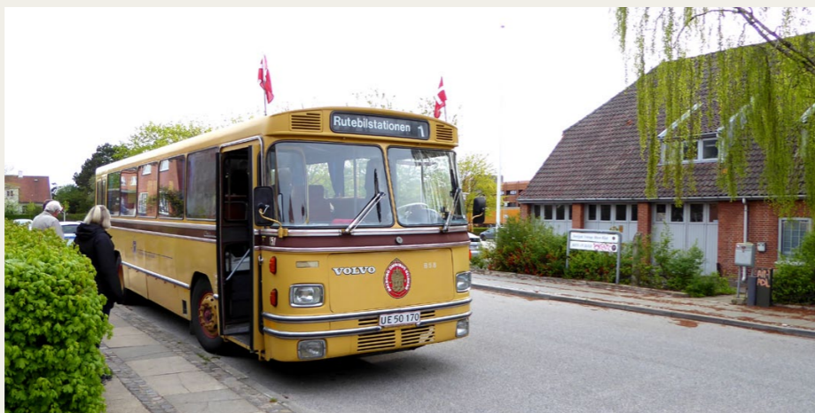
Bussen er ved at være klar til afgang fra Forchhammersvej i Aalborg.