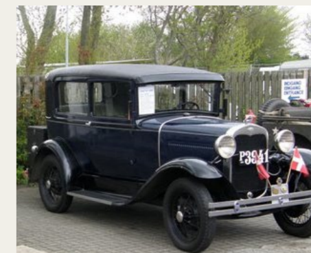
En enkelt Ford A havde i dagens anledning fundet vej til Forsvars- og Garnisonsmuseet.