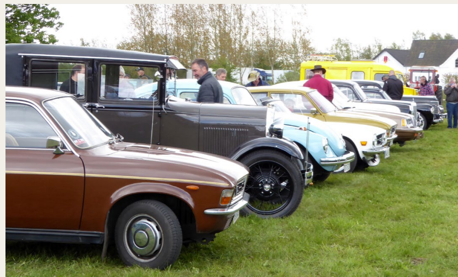
Der var stor variation på de fremmodte veteranbiler.