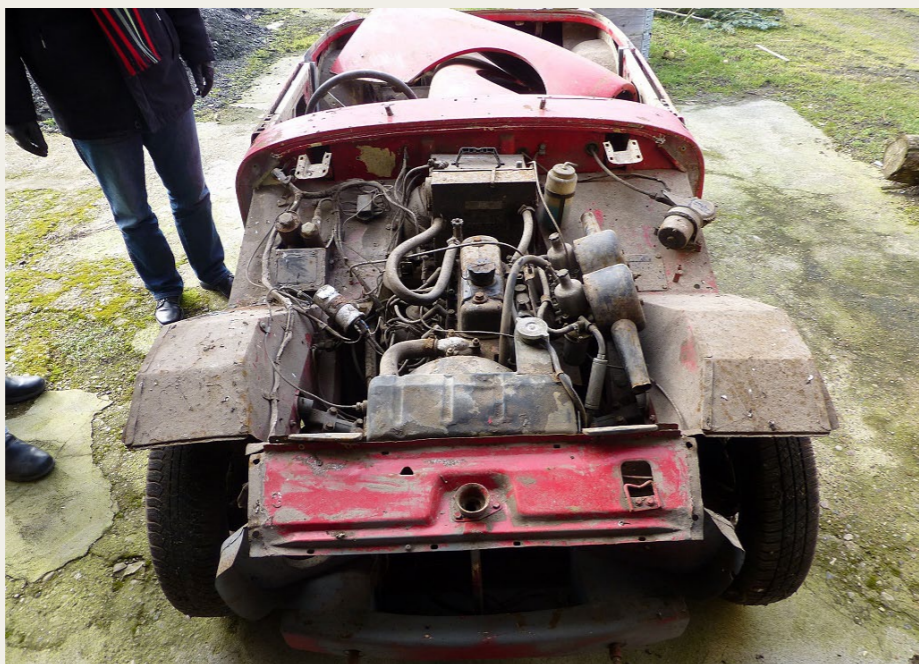
Det ser måske ikke ud af så meget fra denne vinkel, men ifølge papirerne er der allerede lavet en del på Pers nye MG Midget.

Jeg har efterfølgende gransket de papirer,