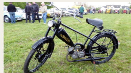
Denne fine Wooler knallert havde også fundet vej til Hjallerup