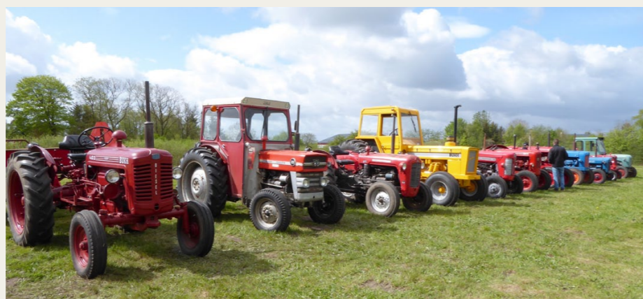
Der var et fint opbud af traktorer på Hjallerup Stumpemarked & Motorhistorisk Træf.

kort af hensyn til en nært forestående deadline for nærværende udgave af Hornet, men der skulle gå mere end en halv time, inden vi overhovedet slap væk fra vores egen bil. Inden vi havde sat informationskiltet op i sideruden, var der flere andre gæster henne for at kommentere eller spørge til vores bil. Er det ikke herligt.