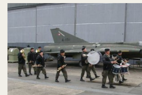
Garnisonens trommekorps defilerede forbi med fuld musik.