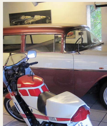
Hos Blokhushuset er der andet end saltsydning at se på.

Fra Aabybro går turen ad små veje til Blokhushuset, hvor vi har første stop. Se nærmere i Hornet nr. 2 fra april om, hvad der skal foregå der. Næste stop der efter er på en parkeringsplads i Blokhushuset, hvor der bliver tid til at gå en tur på egen hånd. Fra Blokhushuset kører vi ad små veje bag om Løkken til Vennebjerg Mølle lidt udenfor Lønstrup. Her vil en fra foreningen „Vennebjerg Møllens Venner“ fortælle om møllen, og forhåbentlig bliver der vejr til, at møllevingerne kan snurre for en ikke alt