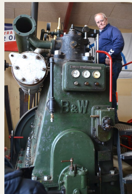
Mogens overvejer ny motor til Bussen.