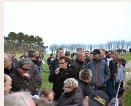
Mange af tilskuerne havde fundet en god plads med udsigt til den snævre viadukt.

ment, gjorde jeg opmærksom på dette, via en del relevante Facebook grupper, og veteranbiler strømmede til. Vejret var helt fantastisk og det resulterede i en masse tilskuere, der både kunne opleve et rigtig godt og spændende race, og indimellem nyde de mange prægtige og flotte veteran