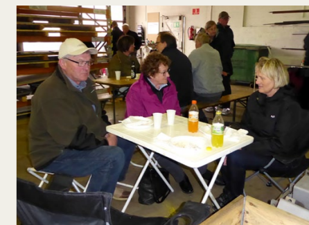
Middagen udviklede sig til en indendørs picnic i en fabriksdal i Dania.

Da vi nåede Hobro blev vi dog enige om at ændre planerne lidt, vi kunne jo ikke spise i det fri og risikere at kartoffelsalaten regnede af tallerknerne - så jeg kontaktede en livline, og vi fik lov at komme ind på et værksted og spise, så vi var i tørvejr.