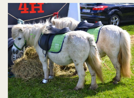
Og der var sågar nogle med rigtige bestekræfter.