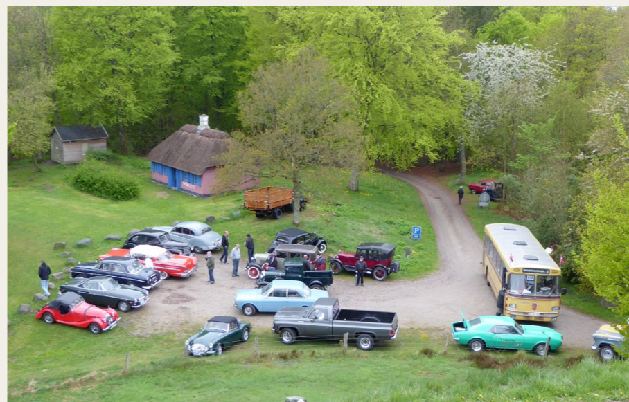
En stor del af de deltagende biler set fra toppen af Hohøj. Det lille røde bus i baggrunden er i dag indrettet som museum for Hohøj og dens historie.