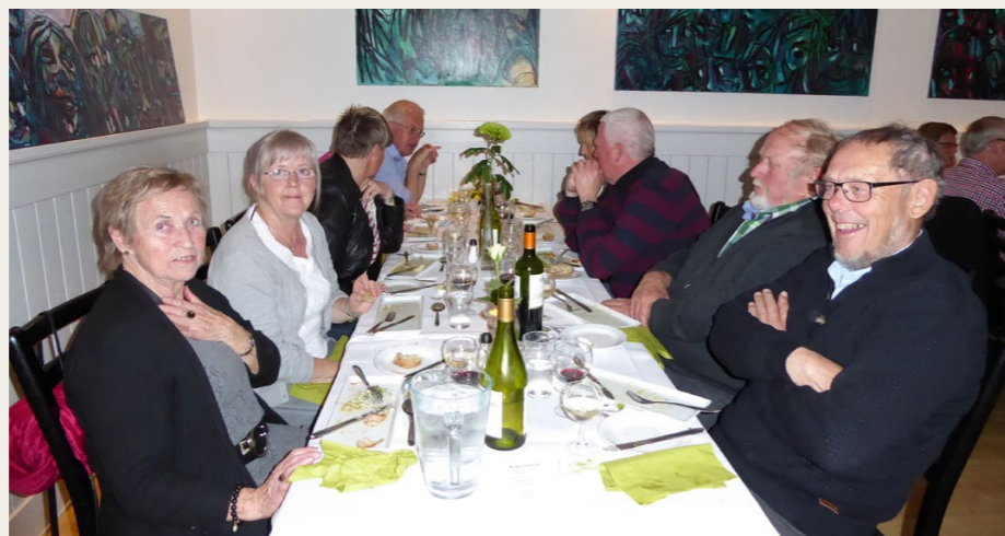
Om det skyldes maden eller betjeningen skal være usagt, men deltagerne var i godt humør.

linger og et par stykker i flexjob. Ud over hoteldrift driver man på stedet også et PC-værksted, som også fungerer som en slags landsbysekretariat.