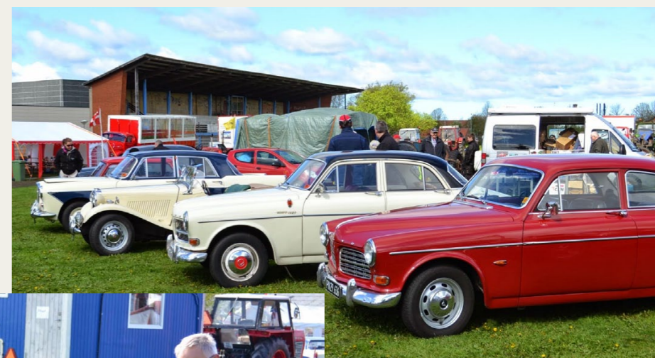
Der blev efterhånden fyldt godt op med veteranbiler på Brønderslev gamle stadion.

Det er den lokale Veteran Traktor Klub, der arrangerer dette træf, hvor det spænder vidt med mange spændende ting, lige fra et stort antal traktorer til stationære motorer, stumpemarked og tohjulede kø-