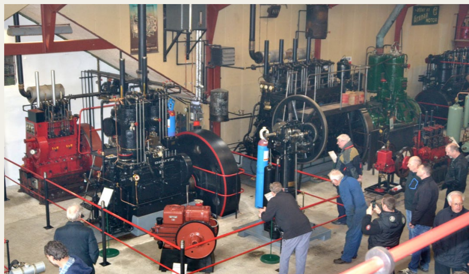
Maskinhallen hos Dansk Motorsamling i Grenaa.