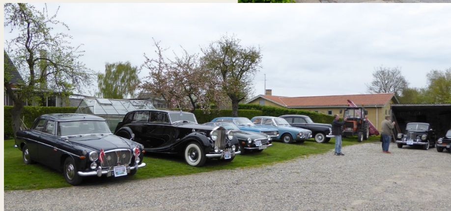
Ved ankomsten til Veddum var der allerede en del biler i gården.