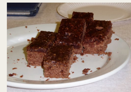
Den hjemmebagte kage var mindst lige så god, som den så ud til.