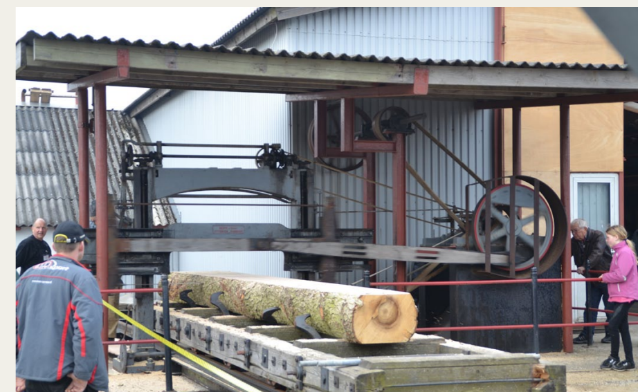
Den store bloksav trækkes af en to-cylindret Buch motor på 50 hk

opgaverne på værkstedet, så allerede den 30. april kom den på „operationsbordet“. Begyndende med udstødningsrøret blev motoren nu skilt ad og gået efter - Det