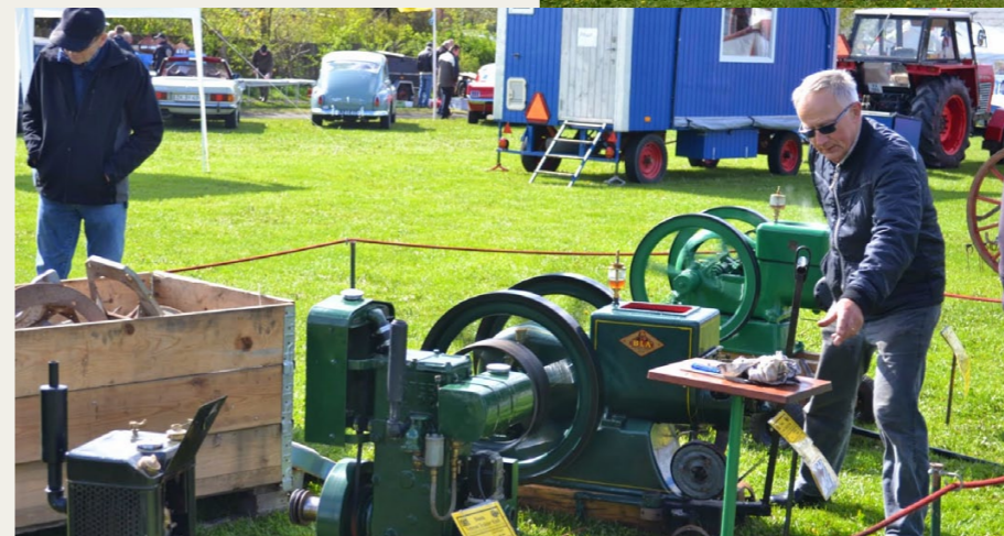
Det er svært at se på billederne, men der var rigtig gang i mange af de stationære motorer.

retojer. Derudover møder der også en del veteran biler op for at deltage, og i løbet af søndagen, hvor jeg deltog, blev arealet efterhånden godt fyldt op.