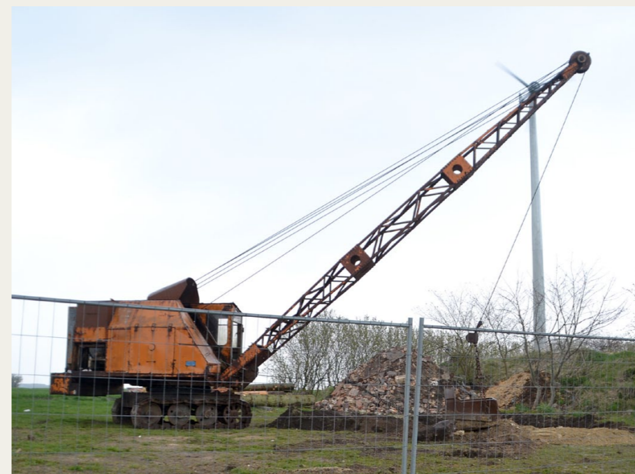
En af motorsamlingens store maskiner er denne gravemaskine model PM-1A, som er fremstillet på Pedershaab Maskinfabrik i Brønderslev i 1951. Selv om jeres gamle redaktør har været ansat på denne virksomhed i 38 år, har han dog aldrig haft noget med design af disse maskiner at gøre, men han har dog været med til at lede efter reservedele til maskiner, der var mere end 50 år gamle.

Bussen blev bugseret op til Volvo Truckcenter, og fordi vi skulle på tur igen allerede den 9/5 - Himmerlandsturen, skubbede man temmeligt meget rundt på