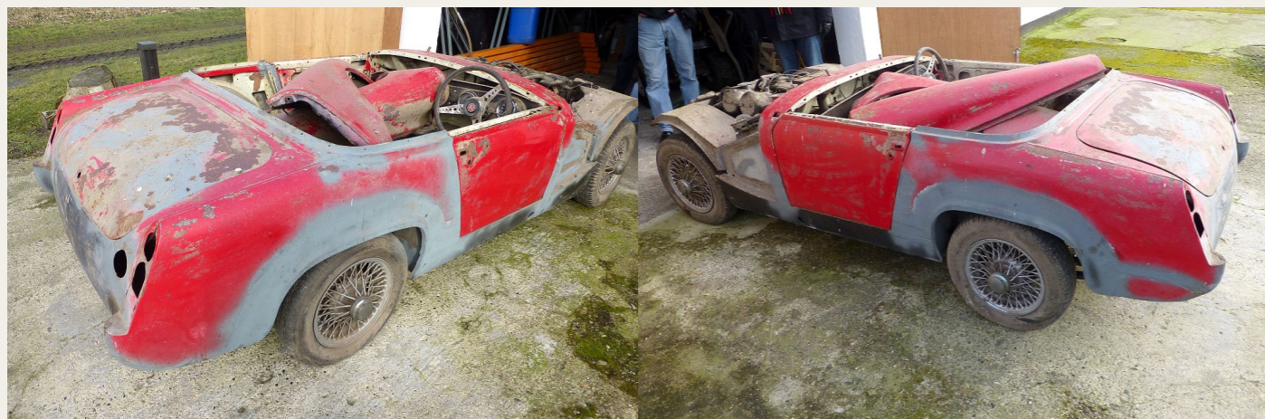
Det bliver spændende at, hvad Per Hejlesen får ud af dette projekt, men det ser da ikke helt håbløst ud