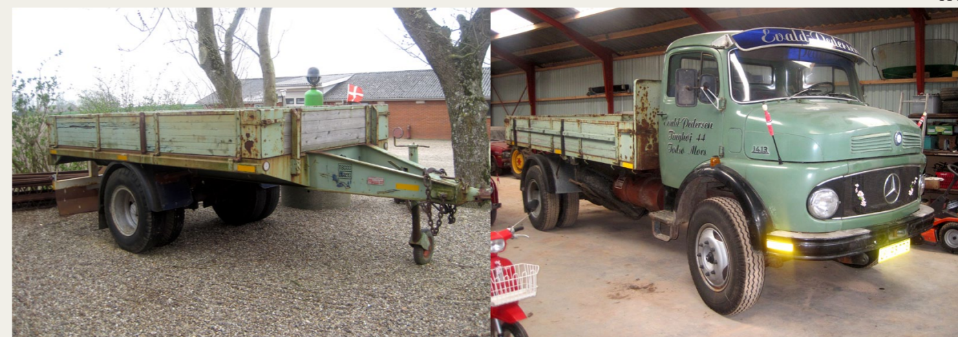
En-akslet kærre med tilhørende lastbil: Mercedes Benz 1413 fra 1966. Begge dele har en fortid på en norsk papirfabrik.