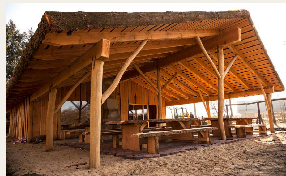
Fælleshuset ved Skipper Klements Plads i Ryaa har både overdækkede og indendørs siddepladser.