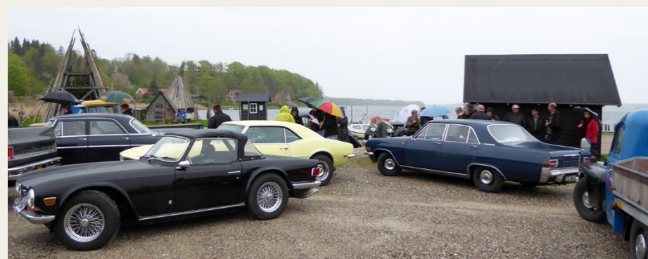
Ved den smukke havn i Stinesminde krøb deltager i ly under udbang og paraplyer, men de forsøgte at løse den udleverede opgave om nationalitetsbogstaver.