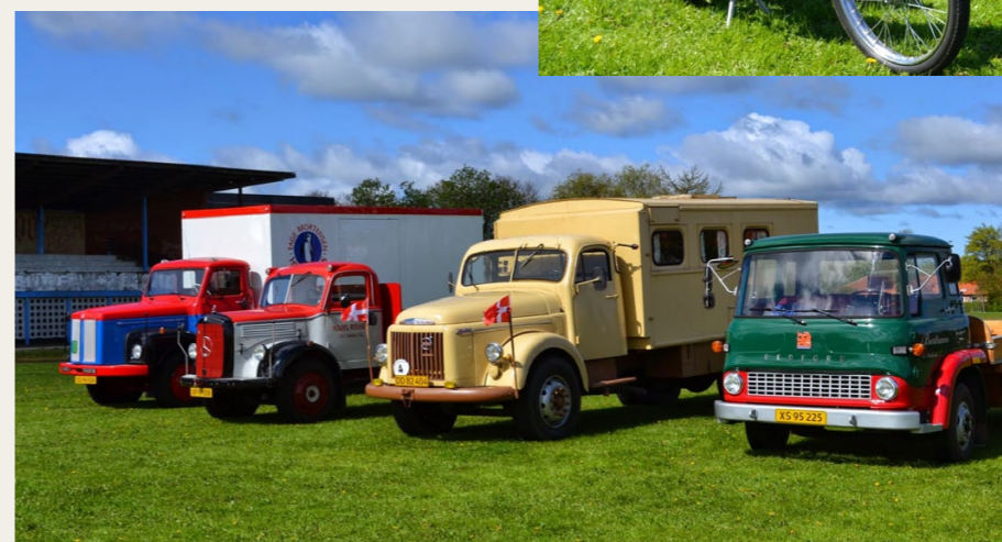
Lastbiler plejer også at være en fast bestanddel af Brønderslev Veterandage.