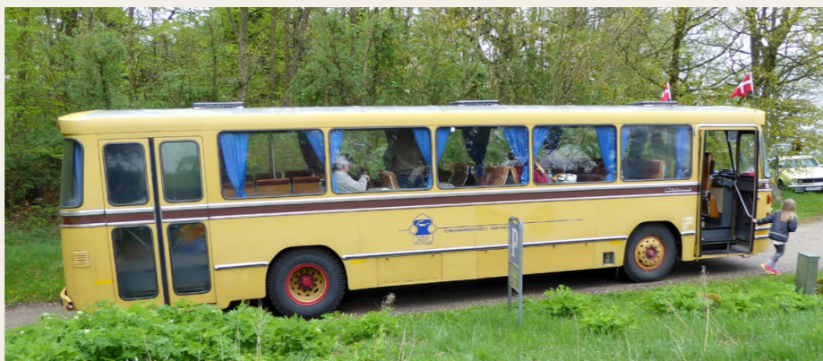
Bussen nåede heldigvis at blive klar. Her ses den ved Hohøj.

Nu var stederne og fortællerne på plads, men af hvilke veje skulle vi så køre?