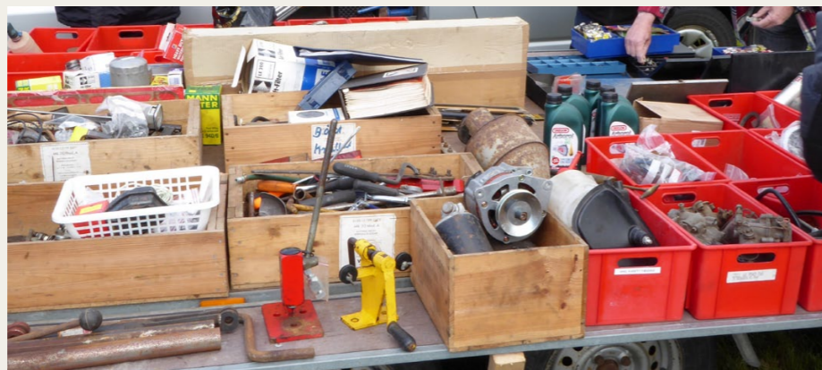
Om det er gammelt ragelse eller guld værd, ja det afhænger vel af om den sjældne stump, du har ledt efter i flere år ligger i en af kasserne..