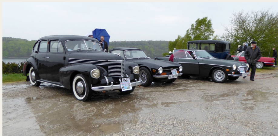
Ved Bramslev Bakker blev pausen kortet af til næsten ingenting på grund af den silende regn.

ramte vi mødestedet Veddum Bygade 9. I gårdspladsen var der allerede kommet en pæn flok, men vi fik bussen kørt indenfor, og vendt så den var klar til at køre - ret efter morgenkaffen. Der blev ved med at komme biler, og til sidst var der, foruden bussen 30 skønne køretøjer - med i alt 72 forventningsfulde deltagere. Efter det overdådige morgenbord, gik vi i køretøjerne - og med bussen som rosinen i