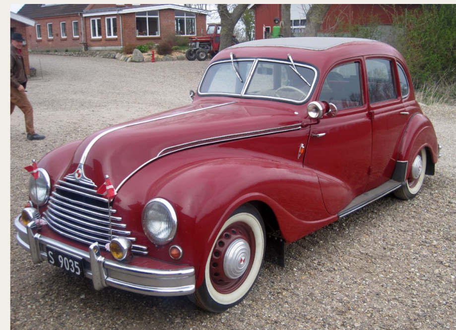
Evalds stolthed og fineste klenodie er denne EMW 340 fra 1952. Et virkelig fint og sjældent eksemplar.